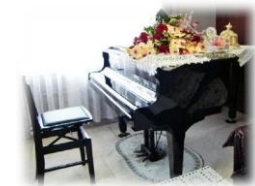
YAMAHAG3 Grand Piano

TEL・FAX 047-338-5778 Mobile 090-2249-6763